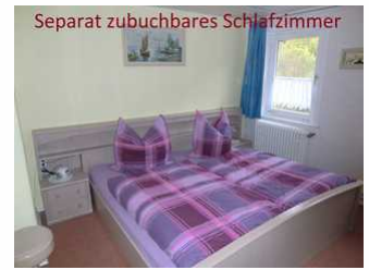
Separat zubuchbares Schlafzimmer

Die Ferienwohnung befindet sich in der ersten Etage eines gepflegten Ferienhauses. Sie verfügt über eine separate Küche, ein Bad mit Badewanne sowie jeweils ein gemütlich eingerichtetes Wohn- und Schlafzimmer.